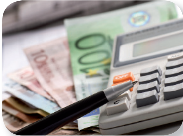
Geld vom Staat mitnehmen