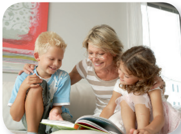
Für Kinder und Enkel sparen