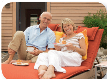
Für später vorsorgen