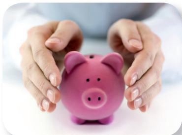
Finanzielles Polster schaffen